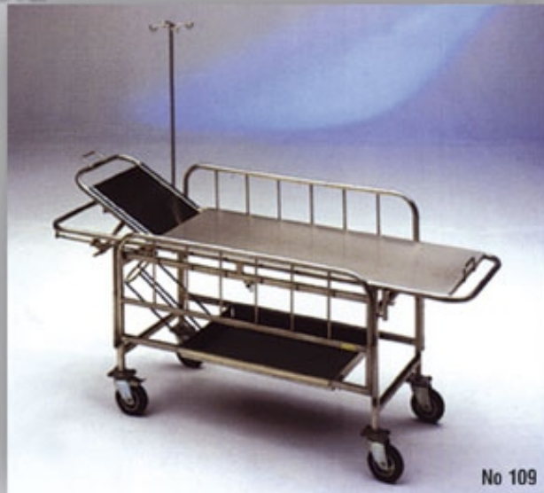
Απλό σταθερό με κάγκελα και στατό ορού με βάση φιάλης οξυγόνου