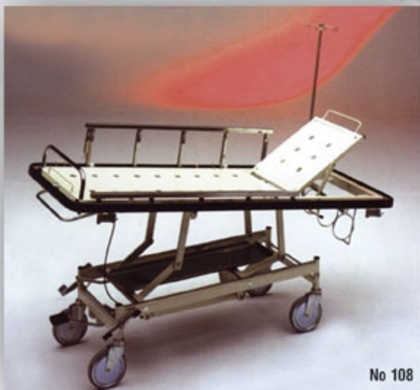
Ακτινοδιαπερατό, κάγκελα, στατό ορού, κεντρικό κλείδωμα με βάση φιάλης οξυγόνου tren-anti-tren